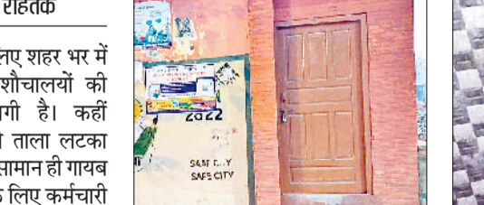
रोहतक। शहर के अपूप घर के पास शौचालय पर लटक रहा ताला।

आमजन को सुविधा के लिए शहर भर में बनाए गए सार्वजनिक शौचालयों की हालत खराब होने लगी है। कहीं शौचालयों पर दिन में ही ताला लटक रहता है तो कहीं नल और सामान ही गायब मिलता है। सफाई करने के लिए कर्मचारी न होने की वजह से भी इनकी दशा बिगड़ चुकी है। अधिकतर वार्डों के पार्श्व शौचालयों की सुध लेने के लिए आवाज उठा चुके हैं, लेकिन नगर निगम पर इसका कोई खास फर्क देखने को नहीं मिल रहा। हालांकि अधिकारियों का दावा है कि टेंडर जारी कर पार्कों का सौंदर्यीकरण करवाया जा रहा है।