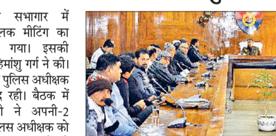
दिशा-निर्देश दिए गए। जनप्रतिनिधियों द्वारा शहर में यातायात व्यवस्था को ओर अधिक सुदृढ़ करने की

रोहतक। पुलिस कार्यालय सभागार में बृहस्पतिवार को पुलिस पब्लिक मीटिंग का आयोजन किया गया। इसकी अध्यक्षता एसपी हिमांशु गर्ग ने की। बैठक में अतिरिक्त पुलिस अधीक्षक पब्लिक मेधा भूषण मौजूद रही। बैठक में बारी-2 से सभी ने अपनी-2 समस्याओं बारे पुलिस अधीक्षक को अवगत कराया। पुलिस अधीक्षक द्वारा सभी की समस्याओं को ध्यानपूर्वक सुना तथा मौके पर ही समाधान करने के लिए संबंधित अधिकारियों को