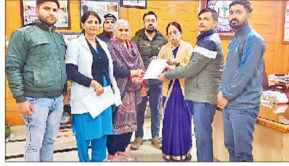
रोहतक। मांगों को लेकर ज्ञापन सौंपते एसोसिएशन के सदस्य।