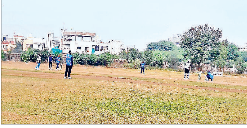
रोहतक। नागपुर में चल रहे 19वें ऑल इंडिया वाइस चांसलर टी-20 क्रिकेट में भाग लेती टीमों।