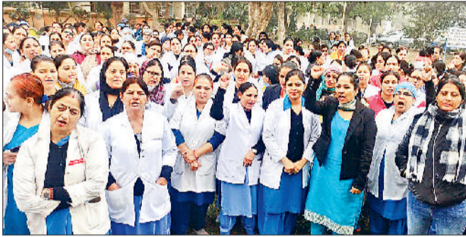
रोहतक। मांगों को लेकर नारेबाजी करते नर्सिंग एसोसिएशन की सदस्य।